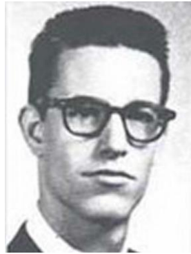
Fotografía tomada en 1963