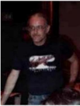
Fotografía tomada en 1984

Se dio a la fuga para evadir el proceso judicial – Tentativa para cometer un delito con la intención de tener relaciones sexuales involuntarias perversas, incitación a un delito con la intención de fomentar o facilitar la comisión del delito de tener relaciones sexuales involuntarias, abusos deshonestos, corrupción de un menor, poner en peligro el bienestar de menores